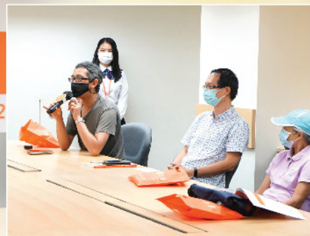
▲ 疫情下，股東們仍撥冗出席股東週年大會支持耀才。