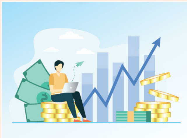
▲ 監管政策風波困擾下，走資風險逐漸增加，建議投資者先靜觀其變。

截至執筆一刻計(8月20日中午)，恒指年初至今下跌8.9%，恒生科技指數更下跌逾30%。若以今年高位計數，恒指則由高位下跌20.6%，科指則下跌47%，市況步入熊市之跡象已浮現。由於此輪調整主要源自監管政策風波，即使事件平息，但飽受政策影響的平台經濟股(即ATM)的長線走勢已呈變數，投資者忌存有胡亂估底之心態，切忌「短線變長揸」。