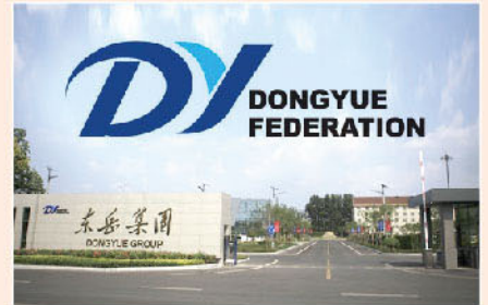
▲ 東岳(00189)今年走勢凌厲，一時無兩。