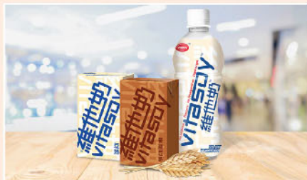
▲ 豆奶產品要打進內地市場，仍有一定難度。

「童年現在一般可愛」是維他奶(00345)1988年一句經典廣告對白，該品牌按理大家亦不會感到陌生。曾幾何時亦是筆者愛股之一，但過去兩年因內地業務發展增速放慢，加上認為估值不低，故其後亦未有再作出推介。而最新業績似乎亦未能令筆者有所改觀。