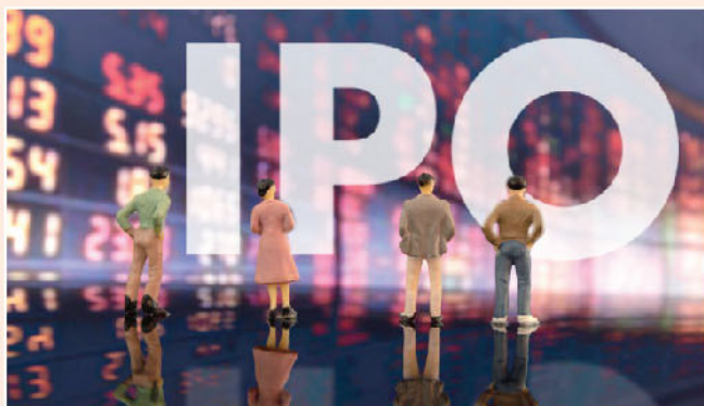
▲ 明年新股市場料仍熾熱，投資者可多加留意。

此外，港交所於12月下旬亦成為突破400元心理關口，除了大市成交金額暢旺外，新股市場表現熾熱相信是主要原因，2020年尾多隻有名氣的新股上市，京東健康(6618)、泡泡瑪特(9992)、藍月亮(6993)、VESYNC(2148)等上市後都有不錯表現，令認購新股的投資者數目顯著增加。市場憧憬下季將會有更多大型新股來臨，包括市傳的「快手」、「嗒嗒出行」、「喜茶」、「奈雪之茶」、「抖音」、「醫渡雲」及「京東物流」將會於明年招股，預料2021年新股市場之反應仍會相當熱烈，投資者不妨繼續密切留意。