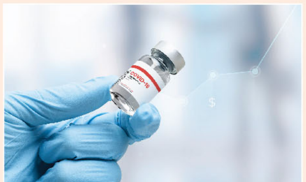
▲ 市場憧憬疫苗面世，可為經濟復甦帶來正面作用。

運股去年業績有憧憬，當中可留意較強勢的中遠海控(1919)及中遠海發(2866)，而較落後的太平洋航運(2343)亦有機會隨著波羅的海乾散貨指數跟隨追落後。