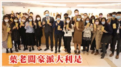
葉老闆豪派大利是