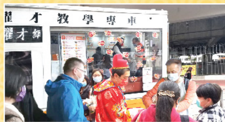
▲ 財神爺隨耀才教學專車走訪全港多區，向各區街坊拜年並派利是！